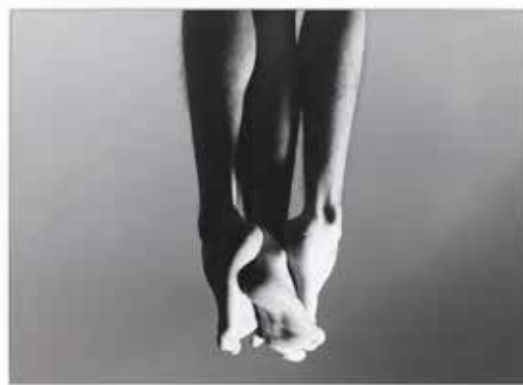
Hra na štvrtého (Michal Pacina, Rudo Prekop, Tono Stano)