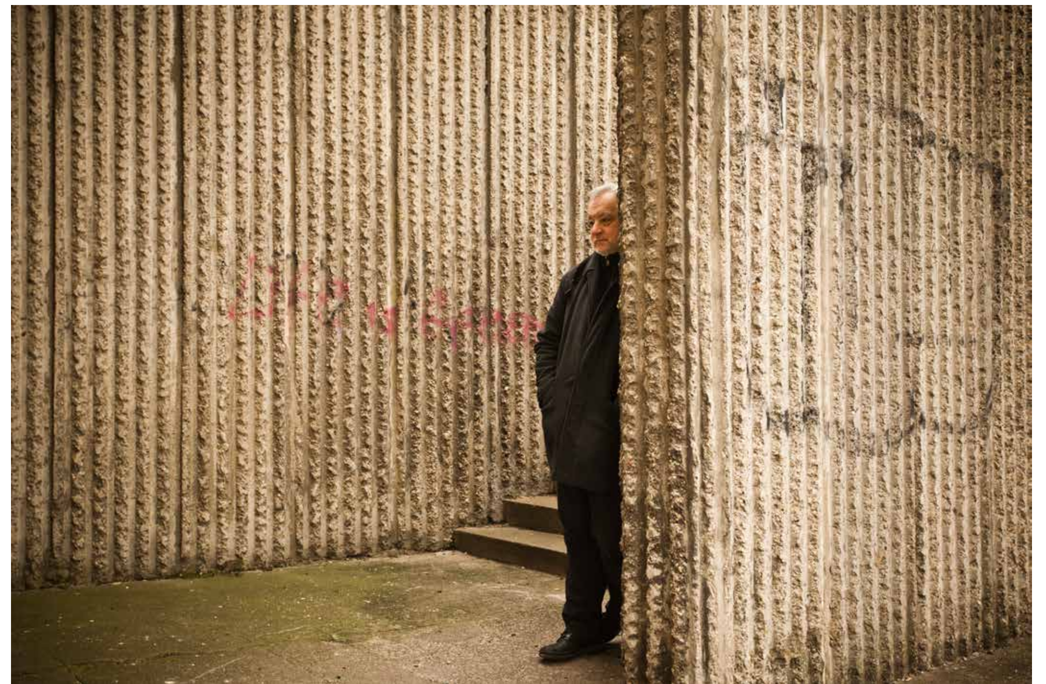
Miro Nôta | Martin Šulík | 2014