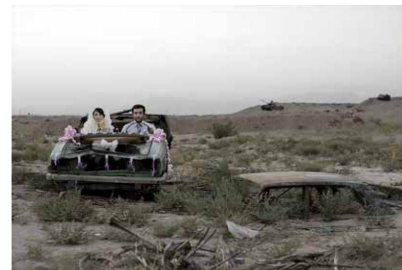
Gohar Dashti | z cyklu Fragmenty spomienok