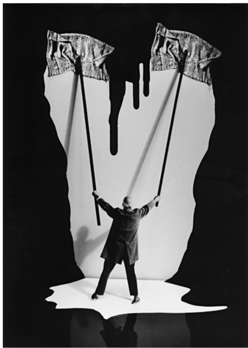
Gilbert Garcin | Faire de son mieux